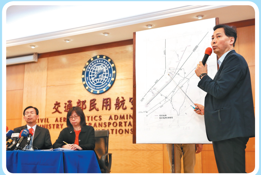
▲ 照／聯合知識庫提供